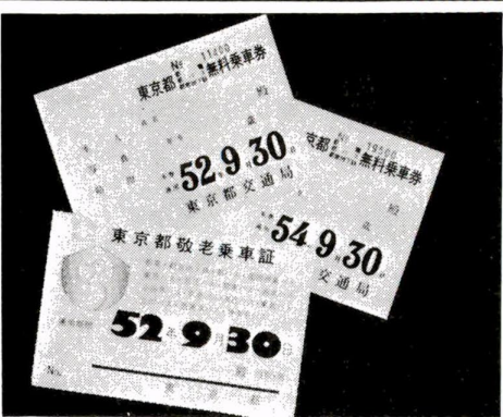
各種無料乗車証(券)

区では、満七十歳以上の方を対したら、旧券は区役所最寄りに、都営交通機関や民営バスにのりこめお返し下さい。 乗車券の発行は、九月末まで使用期間が切れます。新しい「敬老乗車証」は、九月中に郵便でお送りします。十月からは新しい券をご利用下さい。 新しい敬老乗車証を受け取る際、乗車券の係員に提示して下さい。