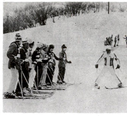
基礎から指導します(区民スキー教室)

■(第一次) 期日 昭和五十一年一月二十一日(土)～二十四日(月)二泊四食 資格 区内在住、在勤の十八歳以上の方 場所 新潟県小出スキー場 交通機関 往復共特急「下千」 利用 往き：上野駅発前七時三十分 帰りに小出駅発午後三時五十分 集合場所 一月二十一日午前六時四十五分 国鉄上野駅団体会待合所