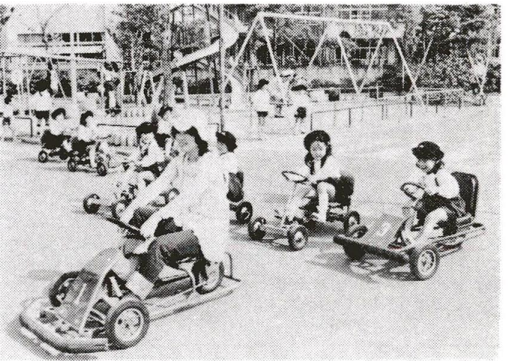
交通公園で楽しむ幼稚園児

現在、区には教育センターと中部区民福祉センターの二か所にプラネタリウムが設置されています。