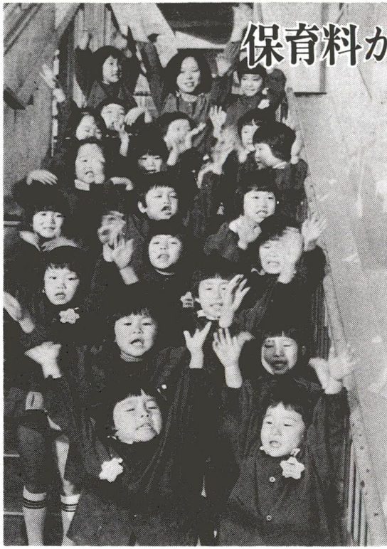
▲子供たちの健全な成長を折って……保育の充実が重点施策

区では重点施策「社会福祉の充実」の一環として、保育園の増設、保育内容の充実などに注いでまいりました。足立の明日をになう子供たちの健全な成長は、みんなの願いだからです。そのため家計への影響も考え、最近の物価上昇にもかかわらず、これまで保育料をすえおいてきました。しかし区の財政状況も大変苦しくなり、やむを得ず別表のように保育料を改訂することとしました。皆さんのご理解とご協力をお願いします。