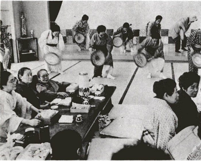
センターでくつろぐお年寄りの皆さん

(昭和51年11月1日現在) 世帯 202,031 男 313,594 女 305,399 計 618,993 (前月より288人増)