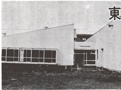
間もなく開館する東伊興児童館

開館は四月一日から 区内には、児童が楽しく安全に遊ぶことのできる児童館や児童センターなどがあります。これらの施設は、すべて自由に無料で利用できるほか、工作や音楽など各種の教室も行なっています。今回は、四月一日オープンする東伊興児童館を中心にまとめてみました。 この児童館は、足立清掃工場の関連施設の一環として建てられたものです。 児童館は、子供たちに健全な遊びを教え、健康増進し、あわせて情操をゆたかにすることを目的として設けられた施設。なかには、図書室、音楽室、工作室などがあり、自由に利用できます。また、留守家庭児童の小学校低学年を対象とした学童保育室もありま なお、この施設には、一般の皆さんを対象とした集会室が併設されています。