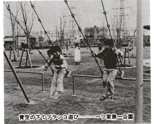
青空の下でブランコ遊び……一ツ家第一公園

まだ成長を続ける足立区は、躍動する青年の区といえます。限らない可能性を秘める青年のグループ活動の中心が青年館です。いたくさんの方が利用されています。