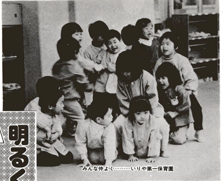
みんな仲よく……いりや第一保育園