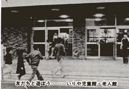
友だちと遊ぼう……いりや児童館・老人館