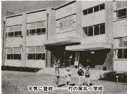
元気に登校……竹の塚北小学校