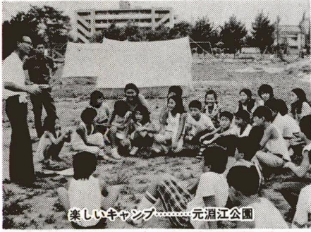
楽しいキャンプ……元淵江公園

いま足立区には62万の人が生活しています。これは20年前の約2倍の数です。そして、行政需要もさまざまな面で増加しています。皆さんのための施設建設も重要な仕事の一つです。乏しい財政のなかで、この一年間これだけの施設ができました。まだ十分とはいえませんが、これからご要望にそよう努力していきます。どうか、皆さんの施設を有効に、たいせつにご利用ください。