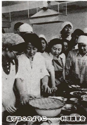
店はこのように……料理講習会