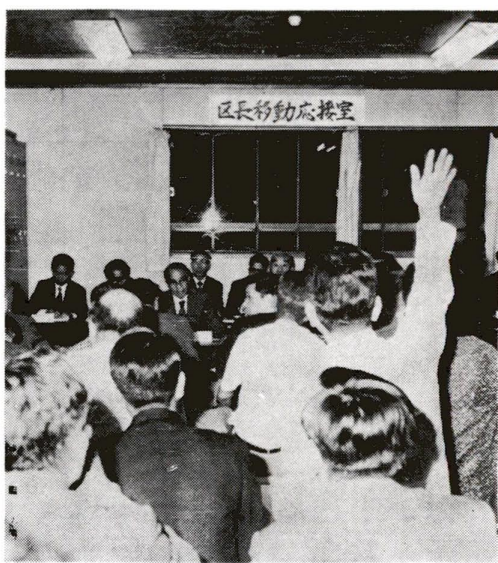
みなさんの声が区政に反映されています

区では、皆さんの声を区政に反映する手段のひとつとして、昨年引き続き区長移動応接室を開きました。今回は、身近な環境問題を主題に、時間も夜間に実施したため、多数の方が参加され、いずれの会場でも熱心に意見の交換が行なわれました。