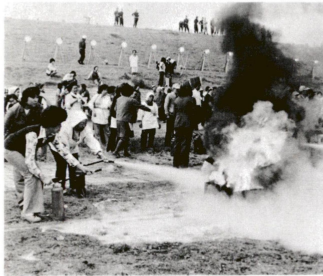
いざ本番にそなえてママさんも消火訓練

大きく変化しています。かつて は木と紙が原料だった家庭に も、化学的に作られた新建材が ふんだんに取り入れられるよう になりました。それらの新建材 は、燃える時に多量の有毒な煙 を出します。 昔から恐ろしいものの代表と して、地震・雷・火災などがあ げられていますが、今はこれに 「煙」を加える必要があるとい われています。 平常の火災でも、煙が原因と なって多くの人命が亡われてい ます。万一、大きな地震が起き たら、火事・煙が発生し、恐ろ しい災害となる可能性が非常に 高いです。