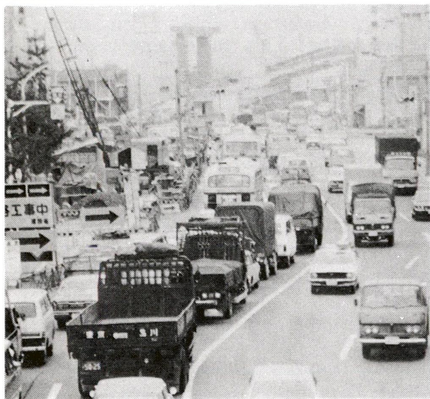
騒音公害の6割は自動車交通