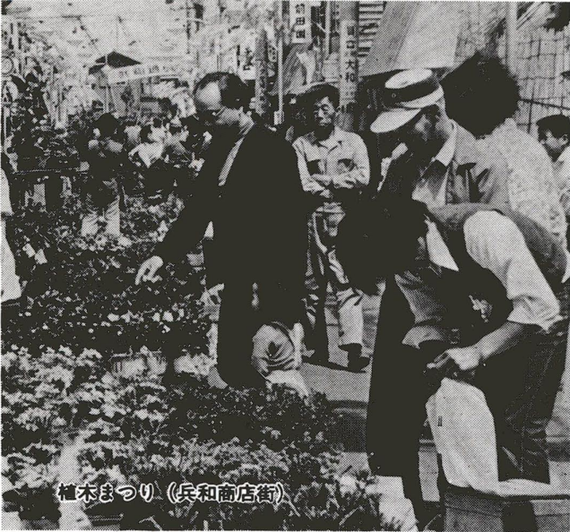
植木まつり(兵和商店街)

本、ポプラ、三十本、ヤナギ、三十本、いすれも、高さ五十センチ、百六十センチ程度です。 配布場所 上の表の所で行ないます。あなたの都合のよい場所を選んでおいてください。 配布日時 いすれも十月八日(火)午後二時～三時 問い合わせ先 区役所緑化係