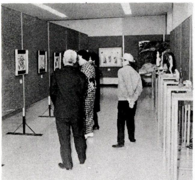
区民の傑作がずらり