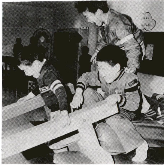
今日も元気に……西保木間児童館