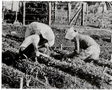
手づくりの野菜を食卓に

都市の中で生活する私たち、自然に親しむ機会が少なくなっています。そこで、区民農園を設置し貸出しを行っています。あなたも、家族ぐるみで自然と親しみ、野菜や花などをつくってみたいかができようか。利用を希望される方は、次の要領をご応募ください。 ○名称・所在地 「古平区民農園」足立区古平千谷二丁目七三の塚駅から入谷循環バスで入谷駐在所下車二分 ○応募要項 ①応募資格 区内に居住し耕作する土地がなく園芸に熱意のある方と六十歳以上の方とよりの方(二世帯一戸内に限りです) ○申込締切 三月十日までの到着分 ○申込方法 必ず往復ハガキを使用してください。左の記入例を参考に往復ハガキに記入し「区民農園申込み」(返封一)に封入してください。