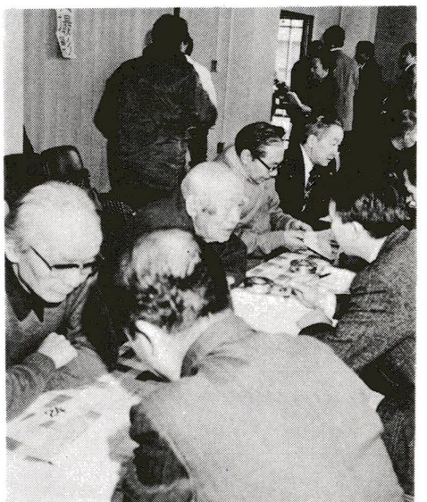
事業団の説明を熱心にきくお年寄の皆さん

昨年六月、厚生省が発表した日本人の平均寿命は、男性七二・二五歳、女性七三・三五歳となり、欧米諸国と比べても屈指の長寿国。我が国の人口の高齢化は近年著しく、二十歳以後には、五人に一人が六十歳以上の高齢者になると予想されています。 このことは、六十歳からの人生が、単に余生を送るといものではなく、地域社会の中でそのなりに重要な役割を果たすことを意味しているのではないのでしょうか。現在の不況下では、働く生きがいの場という側面からみても、高齢者の力をお互いに活用しあうことが必要になっていくなっています。