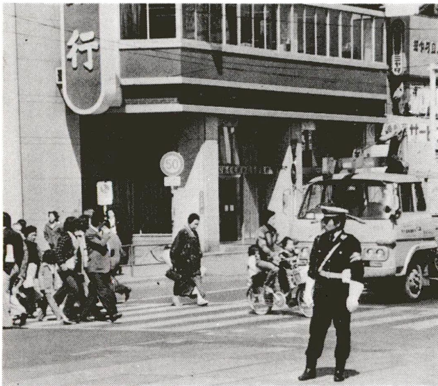
協力しあって、安心して住める町に