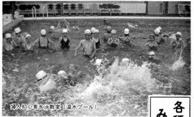
婦人初心者水泳教室(温水プール)