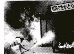
寄付は贈らない 求めない 受けとらない

二月二十八日から三月十三日まで春の火災予防運動が行なわれます。運動の推進には秋に引き続き、防災は自らの手で、家庭も、町も、職場も、一い言に、次のことを重点に行います。 ▽身近な火災危険をなくそう ▽火災を早く気づく安全に避難できる対策をたてよう ▽初期消火、応急救護技術を高めよう 春先は、季節的に大火の多い季節です。家を留守にするとき、また寝る前には必ず火の元の点検をして安全を確認しましょう。