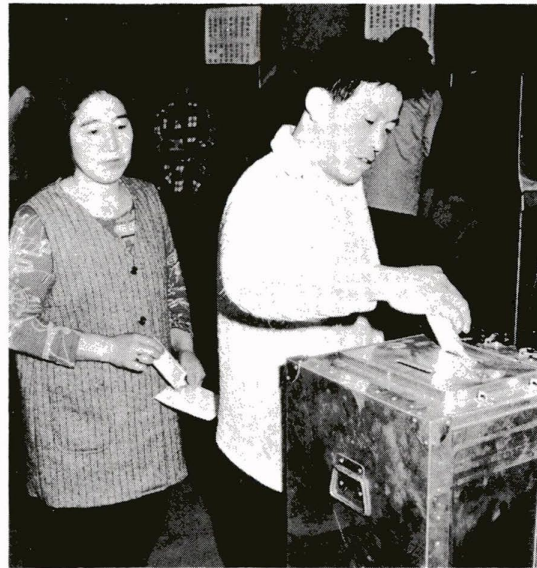
大切にしようあなたの一票を、