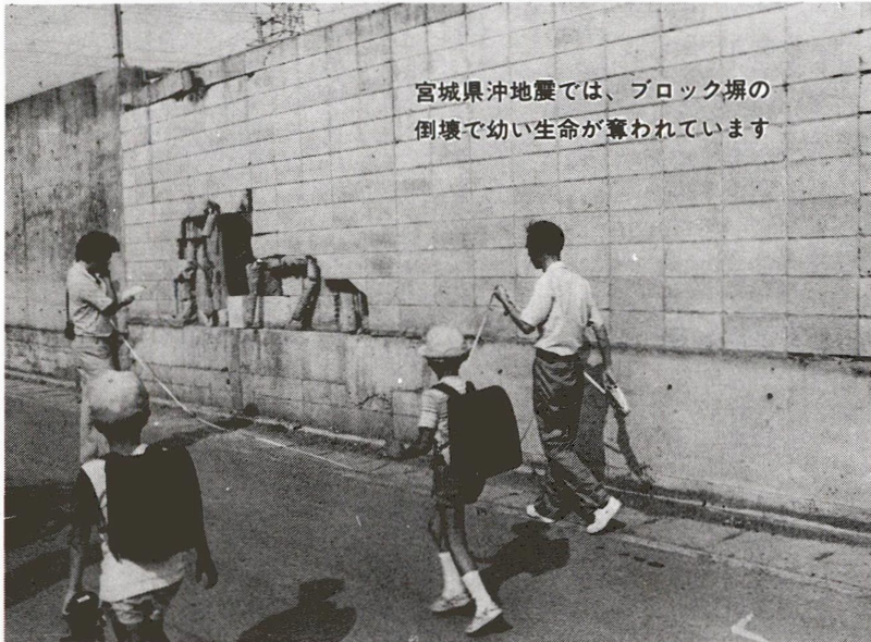
宮城県沖地震では、ブロック塀の倒壊で幼い生命が奪われています