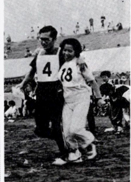
十月十日の区民運動会も近かです。数多く飛び入り種目も用意して、皆さんの参加をお待ちしています。

来年四月から就学のお子さん(昭和四十八年四月二日~四十九年四月一日生)の健康診断を十月下旬から実施します。