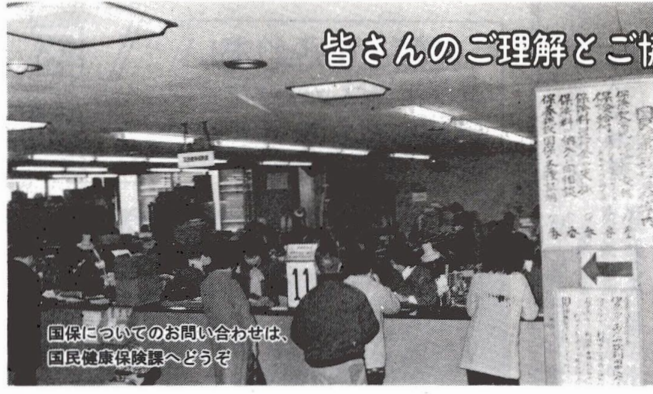
国民についてのお問い合わせは、国民健康保険課へどうぞ