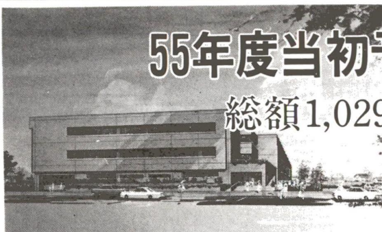
中央本町センター完成予想図