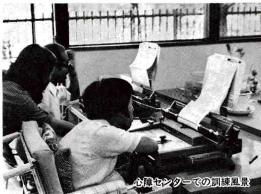
心障センターでの訓練風景