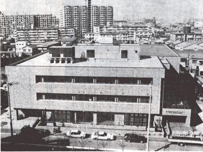
どうぞお気軽にご利用ください

人間性豊かな本れあいのあ、わがまちづくりの施設として、中央本町センター(プロック)の一階部分に、中央本町住区センターが、四月一日に開館しました。