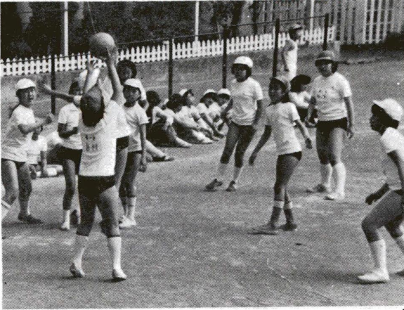
あしたから待ちに待った夏休み。子供たちは、海に山に、そして勉強にとさまざまな計画を立て、楽しみにしていることでしょう。約40日間の長い休み。この期間に、子供たちに創造性を養い、自主的に学習する態度を育ててほしいものです。