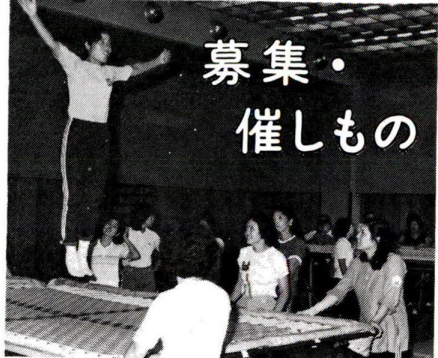
成人学校 受講生募集

申込方法: 8月5日 午前9時より直接、または電話で申し込んでください。 申込・問合せ先: 総合スポーツセンター ☎859-8211