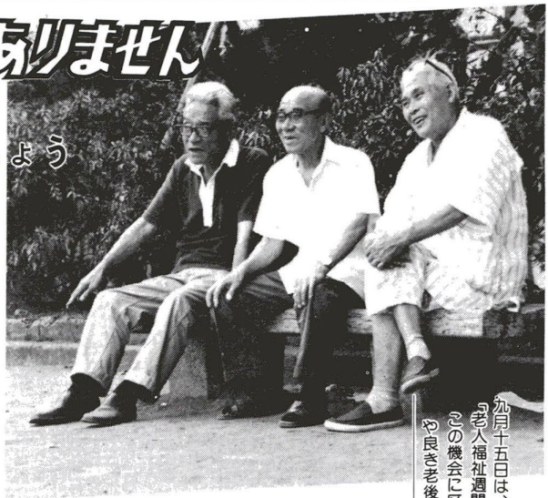
加月十五日は、「敬老の日」。また、この日から一週間は「老人福祉週間」です。一人の人生に「定年」はありません。この機会に区民の皆さんと一緒に、お年寄りの生きがいと良き老後について考えてみたいと思います。