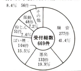
昭和55年度公害苦情受付件数

：BOD(生物化学的酸素要求量)…水中の有機物が微生物の働きによって分解されるときに消費される酸素の量。値が高いほど川は汚れています。 ：DO(溶存酸素)…水中に溶けている酸素の量。 魚の生息には5ppm以上必要といわれています。