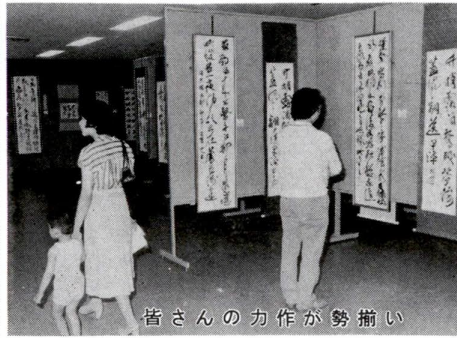
皆さんの力作が勢揃い

「文化の日」を中心に、区民の文化・芸術の向上をめざした第三十二回足立区文化祭を、区内各会場で開催します。区民の皆さんの力作、熱演をご観覧、ご鑑賞ください。