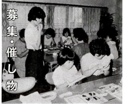
募集・催し物 シンポジウム アジアと 日本の女性