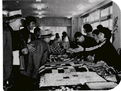
バザー風景 (実習所祭)

お気軽にどうぞ 国民年金相談 区では、国民年金に関する疑問や制度についてよく知りたいために、年金相談を実施します。なお、当日は都国民年金部の専門員が相談にあたります。 日時 三月三日(水) 午前十時～午後三時三十分 場所 区役所二階国民年金課 問合せ先 国民年金課