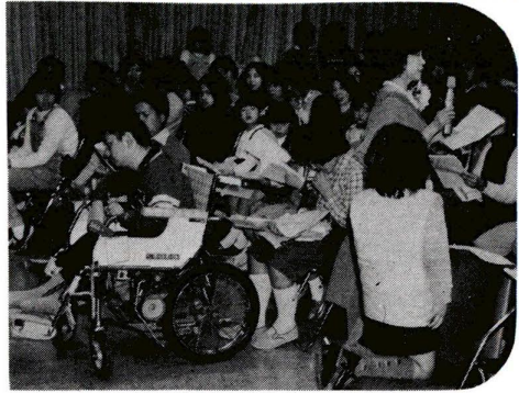
みんなで歌おうコーナー (弥生祭)

心身障害福祉センターと梅島生活実習所で、それぞれ祭を行います。日頃の成果を見ていただくとうみな張切っていますので、どうぞご覧ください。