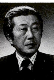
團伊玖磨氏のプロフィール 大正十三年四月七日、東京に生まれる。昭和十二年東京音楽学校作曲卒業。現東京芸術大学作曲部門で山田耕作作曲、ブルジョア芸術家、文筆部門で読売文芸賞。現在、日本芸術院会員。