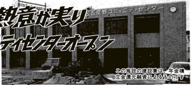
この施設の建設費は、年金積立金還元融資によるものです