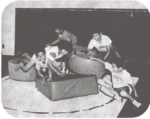
みんなの住区センターです

心豊かなふれあいのあるまちづくりの核として、住民自主管理方式で始めました住区センターが、昭和57年度中に15施設をかぞえるほどになりました。地域社会としてのコミュニティセンターとして管理運営され、住民相互の連帯感の醸成と、まちづくりの輪の広がりに活用されています。