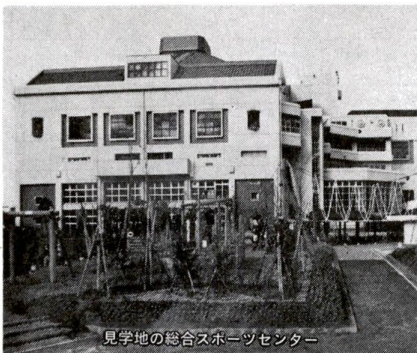
見学地の総合スポーツセンター

区では、区内にある公共施設について皆さまが理解・認識を深め、信頼していただけるよう、マイクロバスによる見学会を実施しています。 今回の施設見学会は、次のとおりを行います。お気軽にお申し込みください。 日時 六月十四(木)・二十(金)の二日間 午前九時～午後四時 申込・問合せ先 広報課