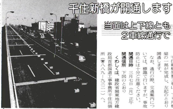
千住新橋が開通します 当面は上下線とも2車線運行で

「また、新米の名もない友愛訪問員、何もわからず、ただ健康と時間に恵まれることも、私にもできず、それがあればいい、昨年、申し込ました。これからは、高齢社会になる世の中で、自分自身を見つめながら皆さんと共に、はげしい気持ちで頑張りたいです。」「私は、親兄弟を世話する...」