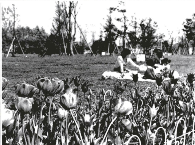
区内の公園にチューリップが3万本

四月は、各地で桜が開花し、いよいよ花の季節の到来です。あたたかい季節にさわられて、街たでみると、春の香りがただよう四月ならではの風情です。皆さんも花を訪ねて散歩してみませんか。