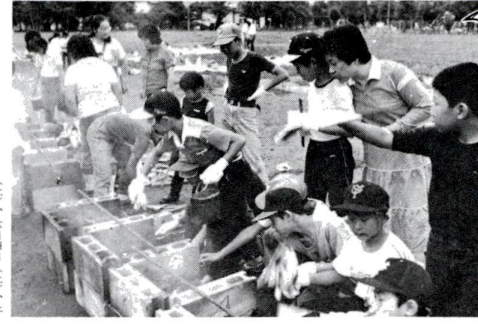
野外活動講座 野外活動の講義的な知識、技 術が習得できる講習会です。修 了者のいる子供会には、キン プ場用品等の貸し出しを どう、(二)参加できる。定員 八名(着順)

一日生活教室 住まいの衛生と手入れについ て考えてみましょう。 日時 五月二十八日(土)、午 前十時~午後 場所 東部センター 定員 五十名(先着順) 費用 無料