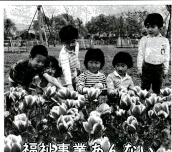
福祉事業あんない

ご参加ください 朗読講習会 朗読グループを養成す るため、次のとおり講習会を開催