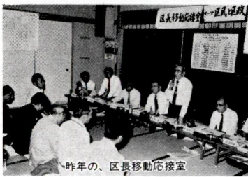
昨年、区長移動応接室

区では、平和な暮らし、区政運営をさらに進め、市民の暮らしを向上させることを目指し、基本計画「実施計画」を定めて、生活基盤整備、生活環境の整備、「活力」といふ言葉で表わされる地域の活性化、「福祉」の充実、「災害」への備え、「教育」の充実、「交通」の整備と取り組んでいます。この実施計画の進捗を、区長が直接皆さんにお話しする機会を設けたいと考えています。区長移動応接室は、区長が皆さんの意見や要望を直接伺い、質問に答える場です。区長移動応接室は、区長が皆さんの意見を直接伺い、質問に答える場です。区長移動応接室は、区長が皆さんの意見を直接伺い、質問に答える場です。