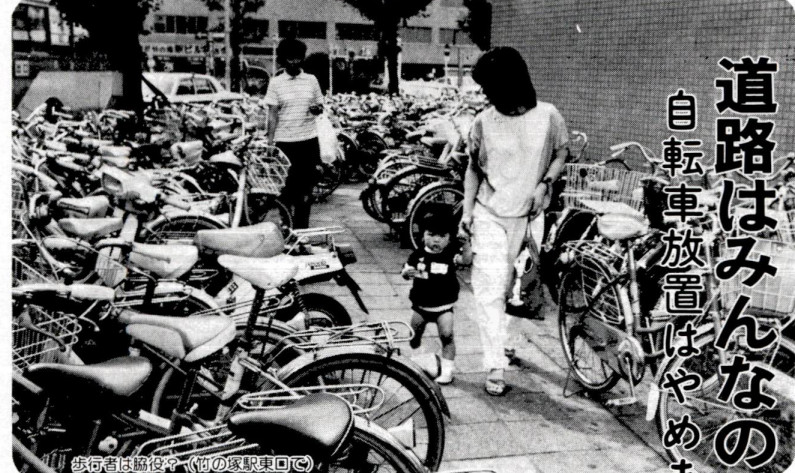
歩行者は迷惑? (竹の塚駅東口)