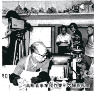
高齢者事業団作業所の撮影風景