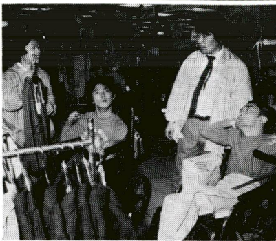
これなんかお似合いですね (洋服店で)

ふるまいが、障害をもつ人を苦しめることあります。また、どんなに設備や制度が改善されても、それを動かす人の心がともなければ、生きたものにはなりません。 ☆ともに暮らせる社会を 障害をもつ人も、障害をもたない人と同じく、一人の人間として最大限に尊重され、平等な機会を市民生活を営む権利が保障されなければなりません。国連の「障害者の権利宣言」や国際障害者年宣言にも、このことが高く掲げられています。障害をもつ人もまた、このことが高く掲げられています。障害をもつ人もまた、このことが高く掲げられています。