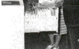
文書管理の改善に向け、進むファイリングシステム

区役所に「情報公開」の正式窓口ができた。権利はない、という見地から、内外のだれにでも窓口を開く。ほかに、区長が、懇話会へ意見を述べ、区に提言します。