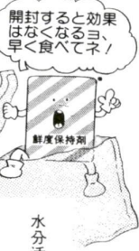
水分活性テスト結果

市販されている菓子やモ子などの包装の中、最近遊離剤に似た小さな袋が入っているのにお気づきでしょうか。これは、食品の新鮮さを保つ働きをする「鮮度保持剤」と呼ばれています。板橋、大田、杉並などの消費者センターと合同で、鮮度保持剤を使用した食品の試買テストを実施しました。検査した食品は、脱酸素剤と粉末アルコールを使用したもの、菓子類4銘柄、モ子5銘柄、生めん8銘柄の合計65銘柄です。この結果をお知らせします。