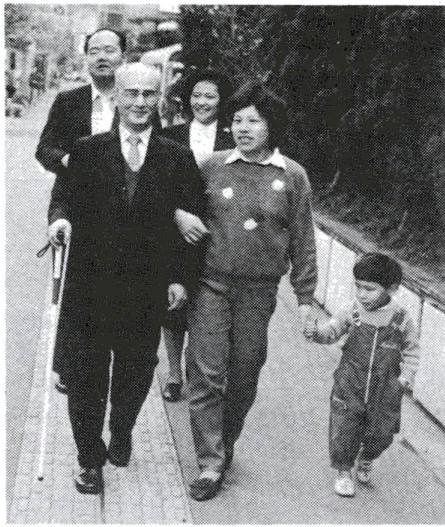
目の不自由な方とガイドヘルパーの皆さん 障害をもつ人様するとき、まず、一人ひとりが別々の人であること認識することがエチケットの基本です。また、困っている様子を見かけたら声をかけて、おたずねしましょう。 心づかいと手だすけのしかた 障害の種類によつて手だすけのしかたが違います。それぞれの障害にあつた手だすけをしなさい。 ▼目の不自由な人に対して ▼正確に意志を伝たい場合は、紙や手のひらに文字を書きましよう ▼電筒が使用できませんので、連絡を頼まれたら気軽に引き受けましよう