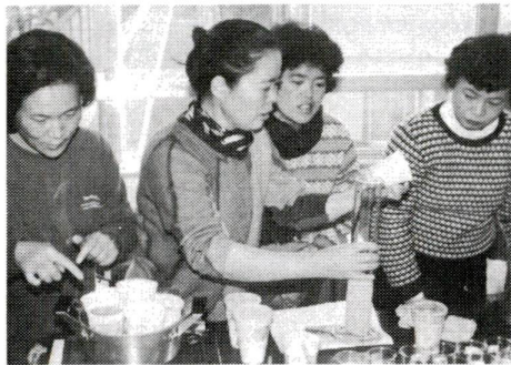
実験するお母さんたち

たちのメンバーでは、みな1%弱の塩分と、まあまあ成績でほととしました。(消費者グループのお母さん方) ○揚げ油は何回使えるのかわからなくて、いろいろな油を持ち寄り、劣化度のテストをしました。10回揚げ物をした油でも悪くならないことがわかり、かなり長い間使えることを知りました。(消費者グループのお母さん方)