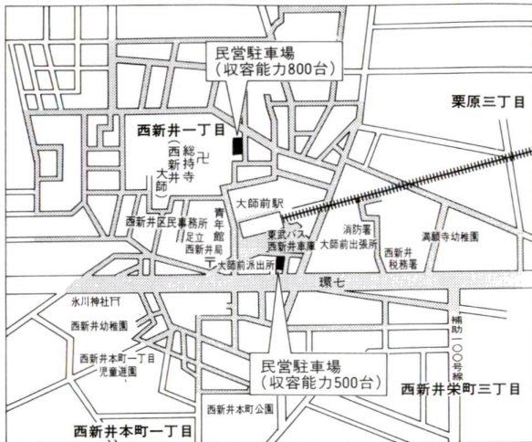
区営無料駐車場(西新井6丁目8,9番 収容能力250台)

消費者講座 豊かさとは何か 今回の講座は、豊かになつたと言われ私達の暮らしはこれからどうなるのか、面から支えきた女性たちとて、豊かさはどのような意味をもっているのかを考へます。