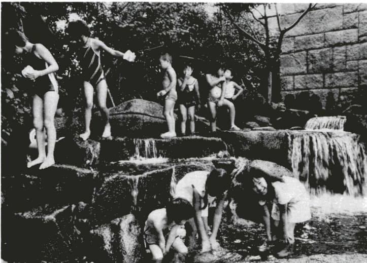
健康・安全・快適・便利なまちを目指します (見沼代親水公園)

△地域の健康を守るため、保健・医療施設の整備を図ります。また、公害・環境対策、分析、引出しのできる環境情報システムを整備を進めます。 △道路の整備、不燃化促進事業等災害に強いつくりを行います。 △道路の整備、不燃化促進事業等災害に強いつくりを行います。