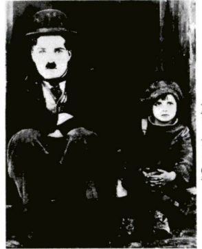
チャップリンのキッド

日時 3月6日(日) 午前10時~午後6時 場所 西新井区民ホールギャラリー 出品者 区展(洋画) 彫塑 書道 の審査員・役員 入場料 無料 問合せ先 本庁舎・文化係 ☎027-1111(代)