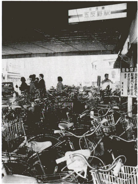
▲五反野駅前、自転車の洪水。みんなできれいにしましょう

昭和58年4月に、自転車条例が施行されて以来、区では、区内駅前の放置禁止区域指定、自転車駐車場整備をすすめるとともに、自転車の放置規制を行ない、すでに12駅中、9駅が実施済みです。このたび、五反野駅、小菅駅を実施することになりましたので、皆さんのご理解、ご協力をお願いします。 3月23日から区では五反野駅と小菅駅周辺約200mの範囲の道路を放置禁止区域(上図)に指定します。 これに伴い、3月23日から27日までの間、地元町会、自治会、商店会、所轄警察署ほか関係各機関の協力により、放置自転車追放キャンペーンを実施します。 3月23日以降、放置禁止区域内に放置された自転車等については、すべへ移送しますので注意してください。 皆さんの理解と協力により、きれいな駅前広場を取り戻しましょう。 問合せ先 本庁舎・交通安全対策課 ☎821-1114