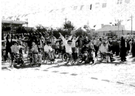
元気いっぱい体育祭 (撮影は昨年)

主体となり、区や公園・公団などの仕事に関する苦情、要望をお聞きします。お気軽にご利用ください。日時・場所 10月14日・15日、西新井区民ホール(二丁目4番) 16日、本庁舎・区民相談室 ※受付時間は、いずれも午後1時~4時