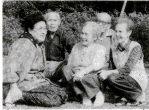
区では豊かな老後を送るための各施策を行っています