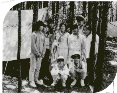
「ハイポーズ」(ジュニアリーダー研修会のキャンプ実技講習から)

キャンプ活動入門 区内少年団体の育成者 を対象に、キャンプ技術を習 得するための講座を開講しま す。1期・2期いずれかに申 し込みください。 日時・場所 内容 左のと おり 対象 区内少年団指導者 および興味のある方、3日 間とも受講できる方 定員 各70人(先着順) 申込方法 所定の用紙ま は、ハガキに住所、氏名、年齢 ▽公徳心を高める行い ご推薦 善行青少年 区では、ライオンクラブ の後援により、良い行いをし 得るための講座を開講しま した。青少年をほめたたえる活動 を行います。 皆さんに住んでいる地域 に、良い行いをした青少年が います。区内に在住・在学・ 推薦対象 区内に在住・在学・ 行動基準 18歳以下の青少年と そのグループ 申込方法 推薦状を提出す るし、周囲を明るくする行い ▽公徳心を高める行い