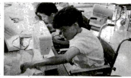
あなたの職場に障害者を

どの人もそれぞれ自分の適性と能力に応じた仕事に就き、充実した日々を送りたいと考えています。障害者が職業の自立の意を持ちながら、障害があることだけで雇用の場に入れられないとすれば、大変残念なことです。会社や工場、商店など、障害者に対する理解や関心が高まるにつれて、健常者とともに仕事に励んでいる障害者も増えてきました。けれども、働く意欲を持っていても仕事に就けず、障害者もまたたくさんいます。 9月は障害者雇用促進月間です。障害者の雇用を促すために、事業主をはじめ、みなさんの理解と協力を願います。