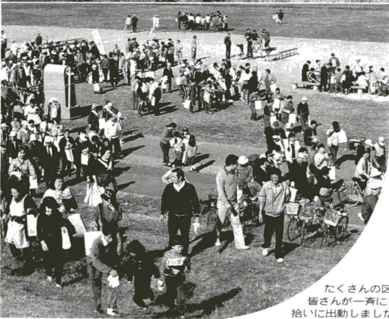
たくさんの区民の皆さんが一緒にゴミ拾いに出動しました

作戦といっても河川大掃除の話。足立区のシンボルとして区民のいこの場の荒川。この荒川で人、自然とのふれあいをもうと深めようと、区では11月13日、区民の方々の協力を得て、河川敷大清掃を行いました。 名付けて「クリーンあらか川(C・G・G作戦)」。Cはクリーン(きれいに)、Gはグリーン(河川敷の緑)、最後のGはグリーンチンク(あいさつ)で「コミュニケーション」を意味します。 作戦は午前10時から11時30分までの1時間半。上から風船を台風に開始され、参加区民は千500人の 手により、あつと言ふ間々、なんとトラック25台分のゴミが集まりました。 この間、ほのほとした親子連れや町会のおなじみさん同士の和気あいあいとした姿が見られ、作戦は大成功に終わりました。 水辺のいこいが提唱されている現在、都の長期計画でも足立区は「川の手ソーン」と位置づけられました。C・G・Gは水辺のいこい、自然とのふれあい復活への新しい展開。来年以降も継続し、清掃以外のイベントも組み合わせ、荒川のコミュニケーションを高めていきます。