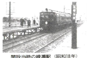
開設当時の綾瀬駅(昭和18年)

日時 1月5日～11日、午前9時～午後8時 場所 エル・ソフィア1階ホール(東武線梅島駅下車徒歩3分) 内容 写真展、「東京の空の下」(昭和44年の足立区空撮ビデオ)の放映他 問合せ先 本庁舎・広報課 ☎882-1111代