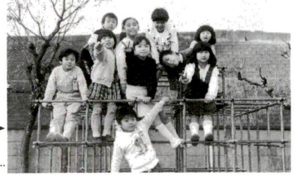
いっしょに遊ぼう！(千住区民福祉センター学童保育室)