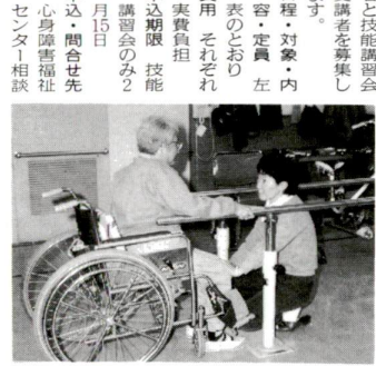
通所部門リハビリテーション部の訓練

心身障害福祉センターでは、4月からの通所訓練希望者・技能講習会受講者を募集します。