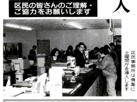
区民事務所は慎重に土曜閉庁を導入します

交通安全一瞬にして家 加入できる方 23区内に住 入る方(外国人も加 入できます) 掛金 1年間1000円 加入し、1年間1000円 加入し、1年間1000円