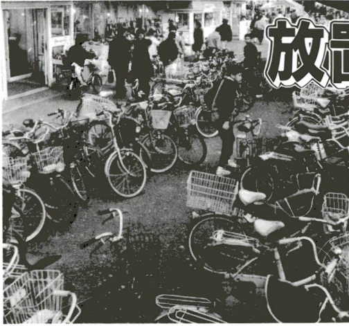
放置自転車が通せんぼ(竹ノ塚駅前)