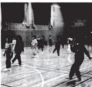
リズムのって、いい汗流そう

健康体力つのにスポーツを始めてみませんか。スポーツの出会い、は、人との出会い。同好の方と知り合うチャンスも生まれます。 日時・場所・種目 下表のとおり 対象 区内在住・在勤の方 16歳以上の方(高校生を除く) 定員 いずれも50人抽選 千住1-4-18 ☎882-1111(代)