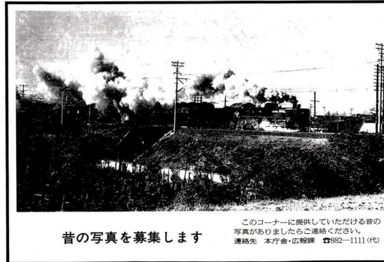
昔の写真を募集します