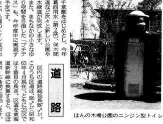
はんの木樺公園のニンジン型トイレ

銭湯は、昔から人々の憩いの場であり、地域コミュニティの中心となってきました。足立区には、伝統的な銭湯と、新しいスタイルの銭湯が並び、それぞれに特色があります。足立区民の生活に寄り添った銭湯の存在が、地域の活性化に貢献しています。