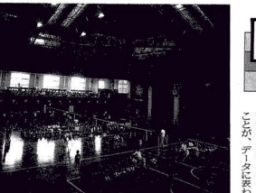
今日もスポーツを楽しむ人たちがいっぱい

足立区は、昭和64年1月1日現在の人口は641,982人、世帯数は239,927世帯、人口密度は12,056人/㎢です。転入は33,162人、転出は33,909人、出生は6,641人、死亡は3,611人です。