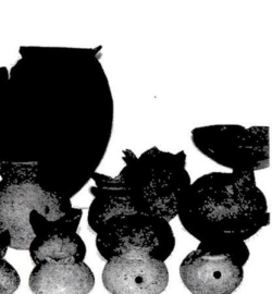
62年度の試掘で出土した土器

今から約千500年前の足立遺跡公園を造成する予定で、人々は、農耕や漁労をして暮らしていました。これまでの調査で、古代の住居跡や生活用具などが数多く見つかっています。特に伊興地区は、遺物の宝庫で、過去に4回昭和32年、44年、48年、62年の発掘調査が行なわれ、その結果、お祭り関係の遺物が多数出土し、質・量とも都下随一、全国屈指といわれています。また、62年度の下水道工事試験にもなる予備調査で、この遺跡が広範囲にわたる集落であることが確認されました。今回の調査が進むにつれ、古代、足立の生活がさらさらわかってくるでしょう。