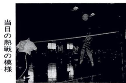
当日の熱戦の様相

足立区は、促成切花チューリップの発祥の地。区内およそ10戸の農家で栽培されています。12月から3月にかけて出荷され、都内の花屋さんの店頭を飾ります。＊広報課では、みなさんの投稿をお待ちしています。まちかど通信、どしどしお寄せください。