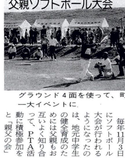
荒川千住新橋緑地で11月3日、第三中学校の父兄による「第10回父親ソフトボール大会」が開かれ、約200人が参加し、さわやかな秋晴れの下で、熱戦を展開しました。