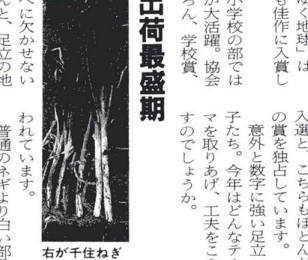
右が千住ねぎ(左は普通のねぎ)

冬のおべに欠かせない長ネギ。なんと、足立の名の付いたネギが、その名をズバリ「千住ねぎ」根張ネギの元祖といわれ、品質の良さも折り紙つきです。 千住ねぎの原産地は、現在の江東区砂町あたり。大阪城が落城した後、敗軍の浪士がネギの種を携えてきたのが始まりと伝えられています。葛飾や足立帯に広まりましたが、よほど千住の地味と合ったのでしょ