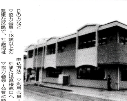
東部障害福祉総合センター

相談 婦人総合センター相談室 出張相談のおしらせ 家庭のごとく職場のごとく、自分の生き方のごとく悩んでいませんか。婦人総合センター相談室(工内)1-34-7 綾瀬ブルミ 6月1日は、人権擁護委員制度が施行された日です。擁護し見守る、いわば民間人による人権の番人の機関