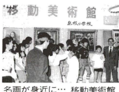
名画が身近に… 移動美術館