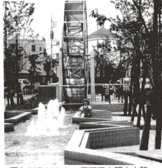
環七以南が完成。葛西用水親水水路