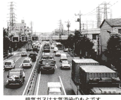
排気ガスは大気汚染のもとです

近隣・生活騒音を少なく 区は、昭和62年以来、足立1号線等の近隣騒音が大きな社会問題となつていて、雨が降っていることがわかります。日常生活で、騒音から守りましょう。